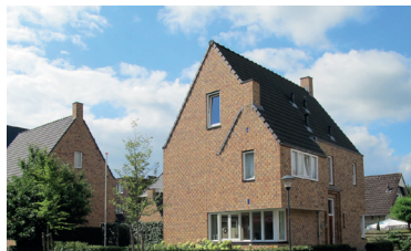
afb. 4 | Referentiebeelden conform het beeldkwaliteitsplan