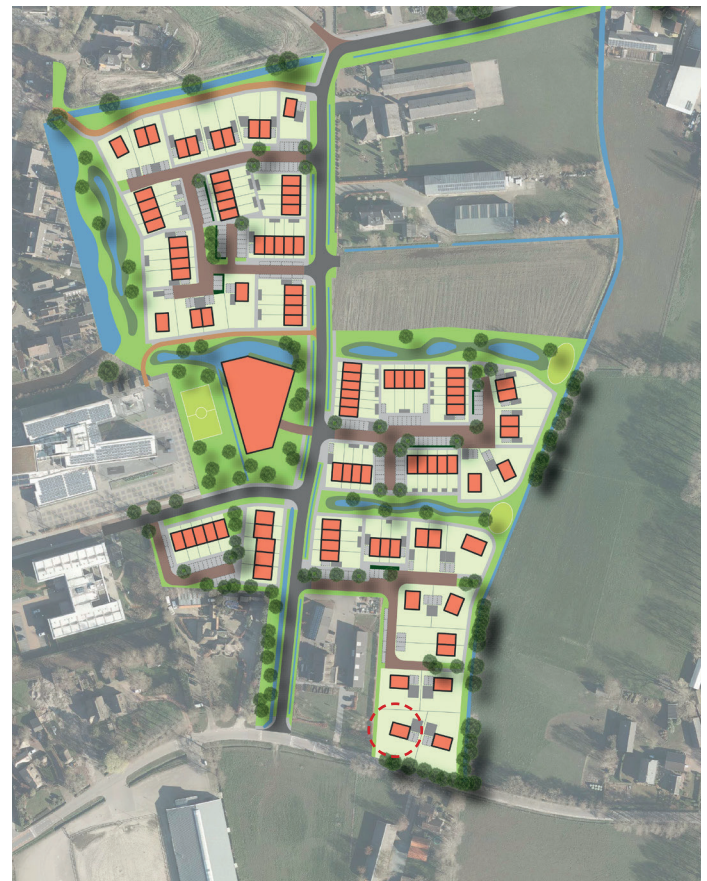
afb. 2 | Bouwvlak, kavelnr. en erfrens